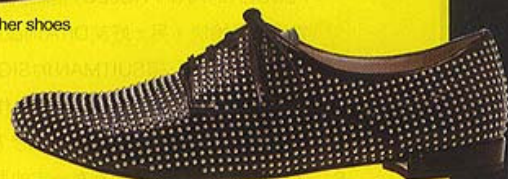
Miu Miu patent leather shoes with stud $5,000