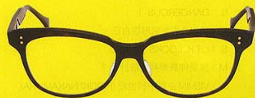
Dita glasses $3,600