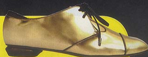
Nicholas Kirkwood gold leather shoes $6,300