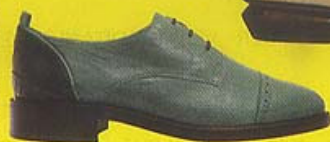
3.1 Phillip Lim leather shoes $3,950

04. Wall Street Bib Shirt $2,400 WALL STREET BIB SHIRT的格仔版，衫袋位置繡上代表SUITMAN的LOGO，有男女SIZE選擇。