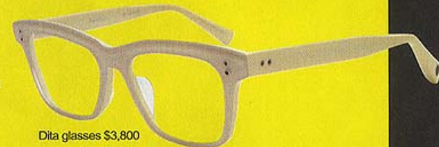
Dita glasses $3,800