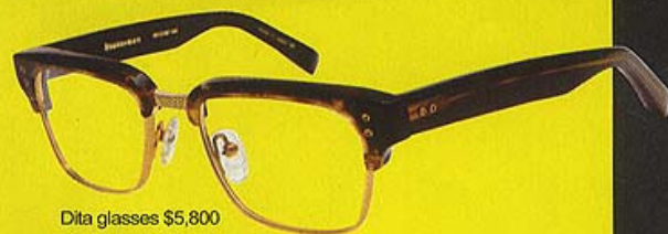
Dita glasses $5,800