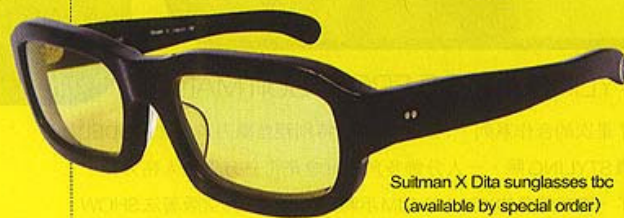
Suitman X Dita sunglasses tbc (available by special order)

AW10 Boyfriend Shoes & Sunglasses Good For Match With Bib Shirt !