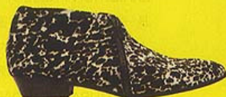
Sigerson Morrison leather shoes $6,100